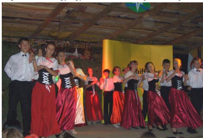
Társastánc a nagyobbak előadásában.