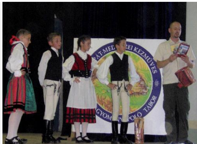
A tuzséri színpadon is jól mutat a remetei székelyruha.