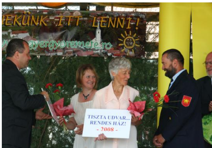
A díjazott porták tulajdonosai egy évig mentesülnek a házadó alól.