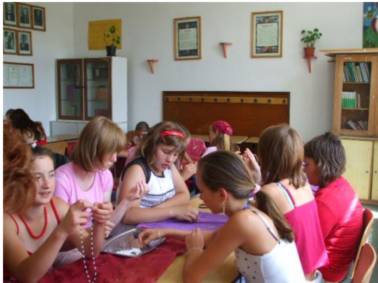
Aktív pihenés. A vakáció ideje alatt jutott id a kézm vességre.

A résztvev k gyöngyöt f ztek, gyurmáztak, bogoztak, pa-